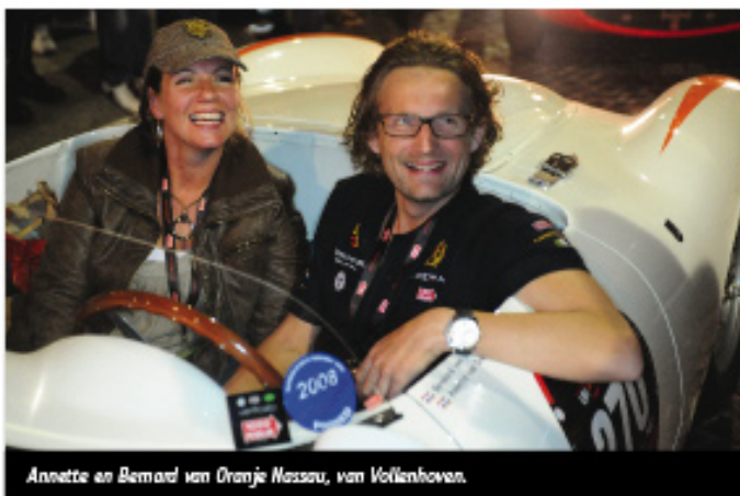
Annette en Bernard van Oranje Nassau, van Vollenhoven.