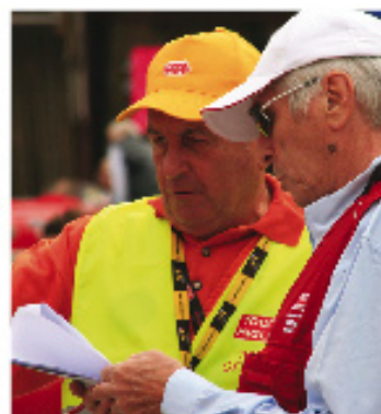
De controle was scherp.

State of Art is sponsor van de klassieke autorally Mille Miglia. Nog nooit reden er zoveel Nederlanders mee als dit jaar. Het uitgebreide artikel kunt u lezen op pagina 98.