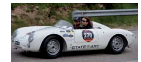
Op www.McTAR.com vind je een compleet foto-verslag en alle uitslagen.